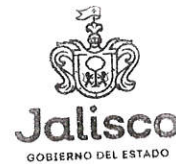
ING. ENRIQUE ALFARO RAMÍREZ Gobernador Constitucional

Coordinación General Estratégica de Gestión del Territorio